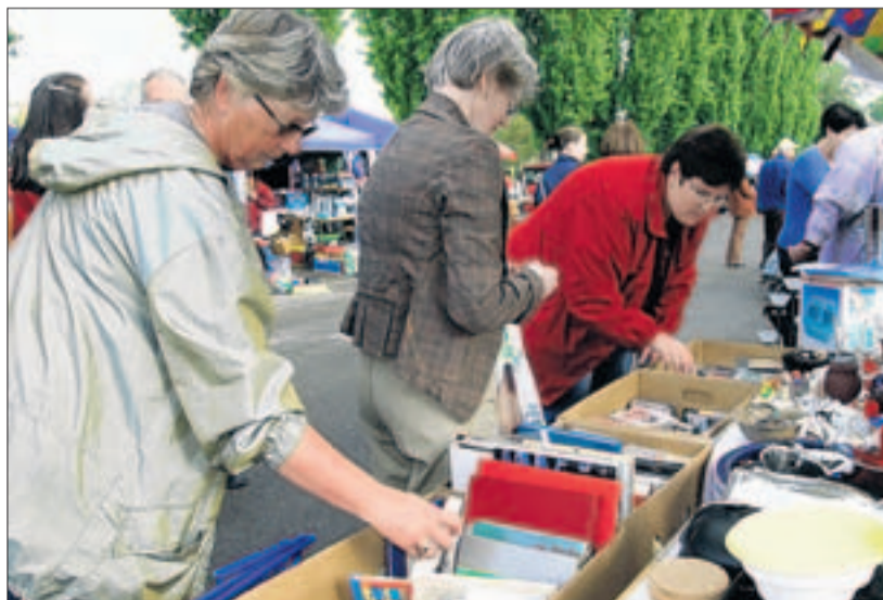
Die Kundschaft genoss offensichtlich das Stöbern in den Kisten und auf den Tischen bei schönem Wetter.