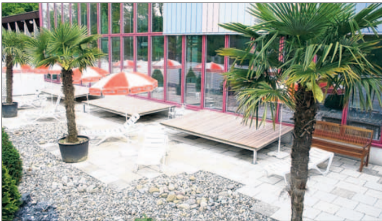
Der windgeschützte Aussenbereich ist gegen Süden gerichtet und durch einen Notausgang des Hallenbads zugänglich. (hz)

Eine Herausforderung stellt auch die Verpflegung über Mittag der über 800 Personen in der Stadthalle Bülach dar. Hansjörg Jud, Präsident des Männerchors Winkel-Rüti, wird am 2. Juli gleich selber zum Kochlöffel greifen und ist zusammen mit anderen Küchenprofis verantwortlich für das Mittagmenü. Erstmals an einem Bezirksgesangsfest gibt es am Nachmittag einen freiwilligen Show-Wettbewerb: Die Vereine haben die Möglichkeit, zu einem zugeteilten Lied eine Show zu zeigen. Nach 15 Uhr erhalten die Chöre ihre Zertifikate – im Idealfall mit der Note «hervorragend».