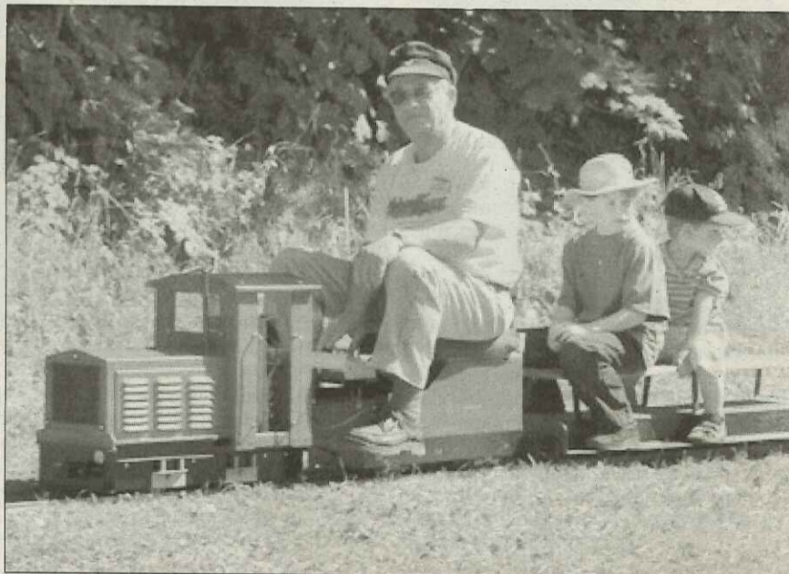
Für die grossen und kleinen Kinder wird eine Modellbahn der OMB Gartenbahn um das Mehrzweckgebäude unterwegs sein

Schon 1975 hatte Max Heller, damals als Lokführer bei der SBB, für einen besonderen Anlass eine dreiaxlige Dampflokomotive auf der Fünf-Zoll-Spur (127 Millimeter) gebaut, welche auch später immer wieder an verschiedenen Anlässen zum Einsatz kam. Zusammen mit seiner Frau Margrit und